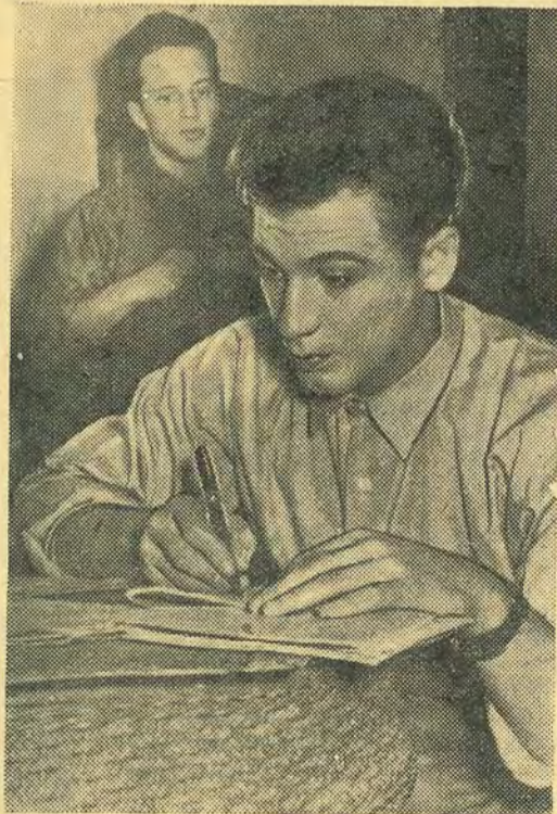
Декану потом не докажешь...

В «гримерной» (как уютно здесь теперь, когда возле стены встало скромное пианино!) за столом у зеркала сидит пожилой человек с глубокими складками морщин на лбу, колючей щетиной усов и спавшей на лоб непокорной седой прядью волос. В первую минуту трудно узнать в этом посеревшем лице известного нам всем