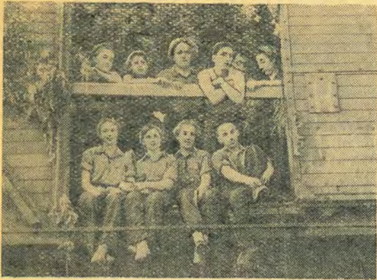
В дорогу дальнюю, дальнюю, дальнюю... (Снимки, сделанные на целине в 1956 г.)

В прошлом году мы вложили немало сил в казахстанский миллиард.