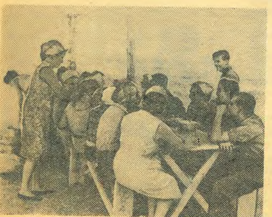
На отсутствие аппетита никто не жаловался.