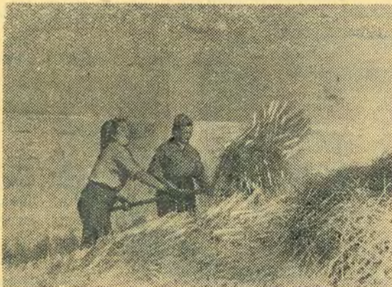
Эх! полюшко, поле...