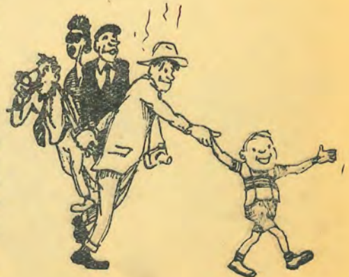
Рис. В. Ореханова.