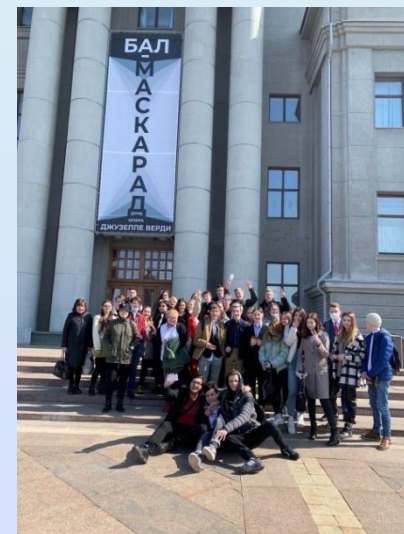
Посещение театра оперы и балета