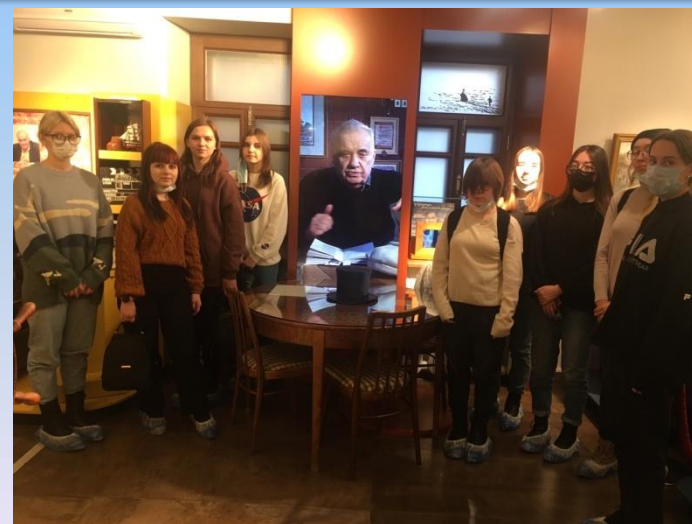
Экскурсия в музей Э. Рязанова