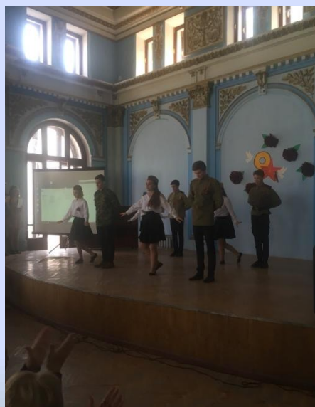
Концерт ко Дню Победы