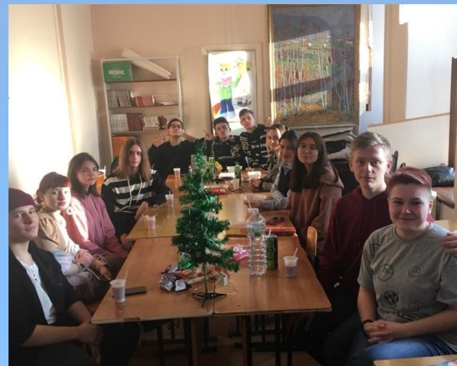
Собрание литературного кружка