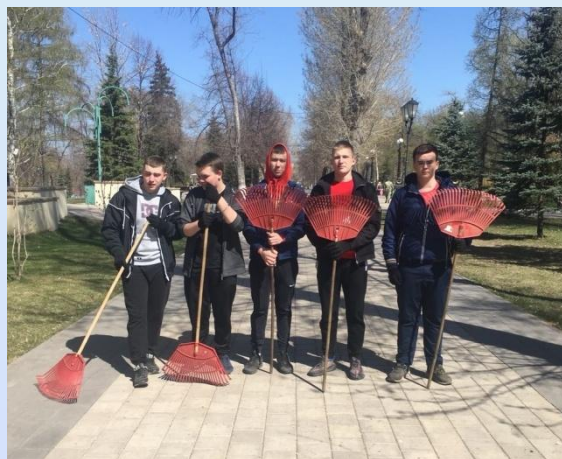
Субботник в Струковском парке