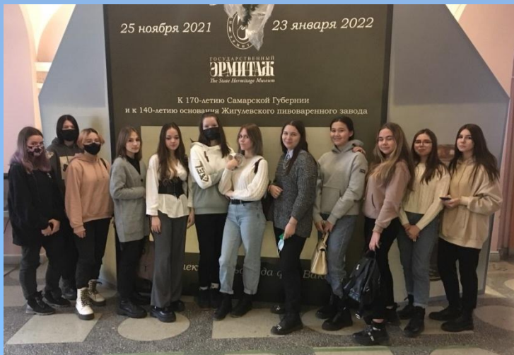
Посещение областного художественного музея