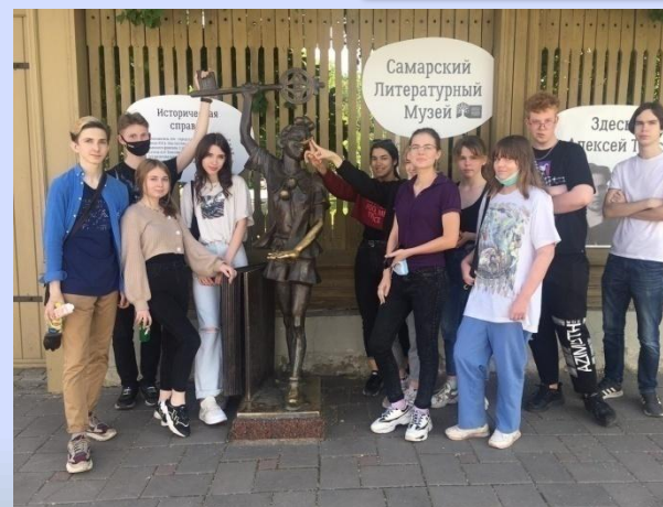
Экскурсия в дом-музей А.Толстого